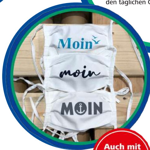
(verschiedene Farben und Modelle, Abbildung ähnlich)

Doppellagig für die zusätzliche Nutzung eines Filtermaterials. Diese Mundmaske ist perfekt zum Laufen, Radfahren, Wandern oder für den täglichen Gebrauch.